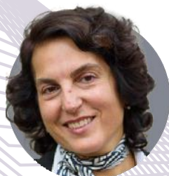
Tina Paille, FRICS RICS 当选总裁